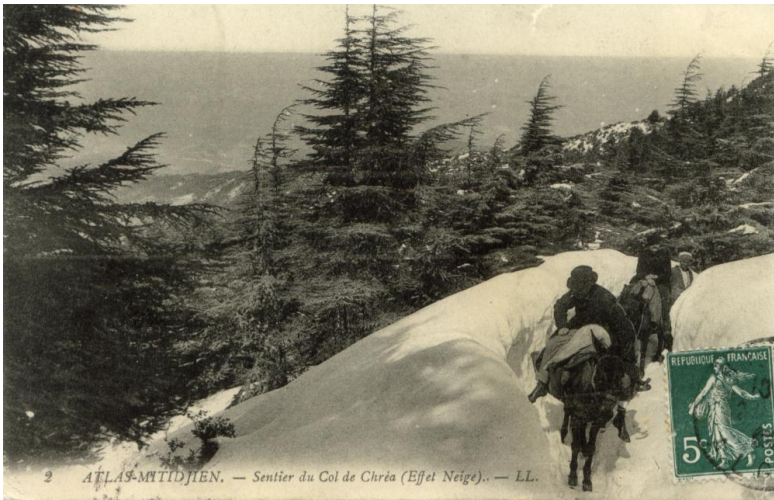
2 ATLAS-MITIDJIEN. — Sentier du Col de Chr a (Effet Neige). — LL.

Il faut aussi signaler qu'un nombre important de sportifs font tout le chemin   pieds.