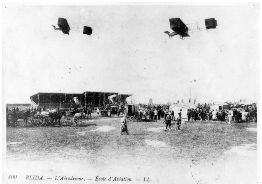
400 BLIDA. — L'A rodrome. —  cole d'Aviation. — LL.

Mais   Blidah, il y a aussi l' cole de pilotage de Mr R. M trot. Depuis son inauguration courant janvier, une dizaine d' l ves suivent leur formation sur l'hippodrome de Joinville. Ce qui est amusant, c'est que le dimanche de nombreux spectateurs viennent en voiture, certains d'Alger, pour