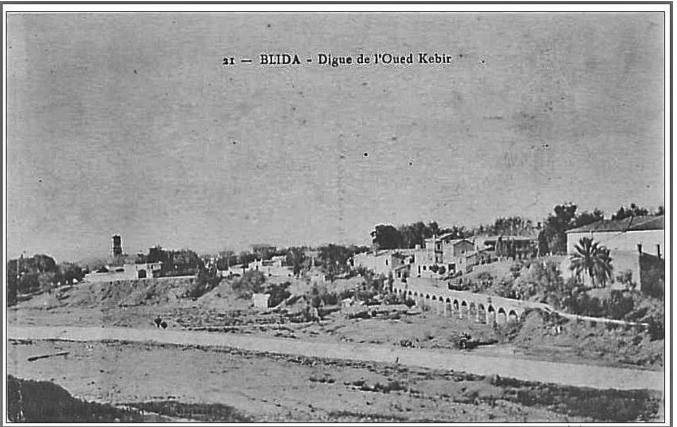
21 — BLIDA - Digue de l'Oued Kebir

Un autre grand projet dont je vous avais parlé l'an dernier est toujours à l'étude en ce moment. Il s'agit de la construction d'une digue pour protéger la rive droite de l'Oued el Kebir et d'une autre à l'Oued Yakor pour protéger les 3 cimetières chrétien, israélite et musulman. (3)