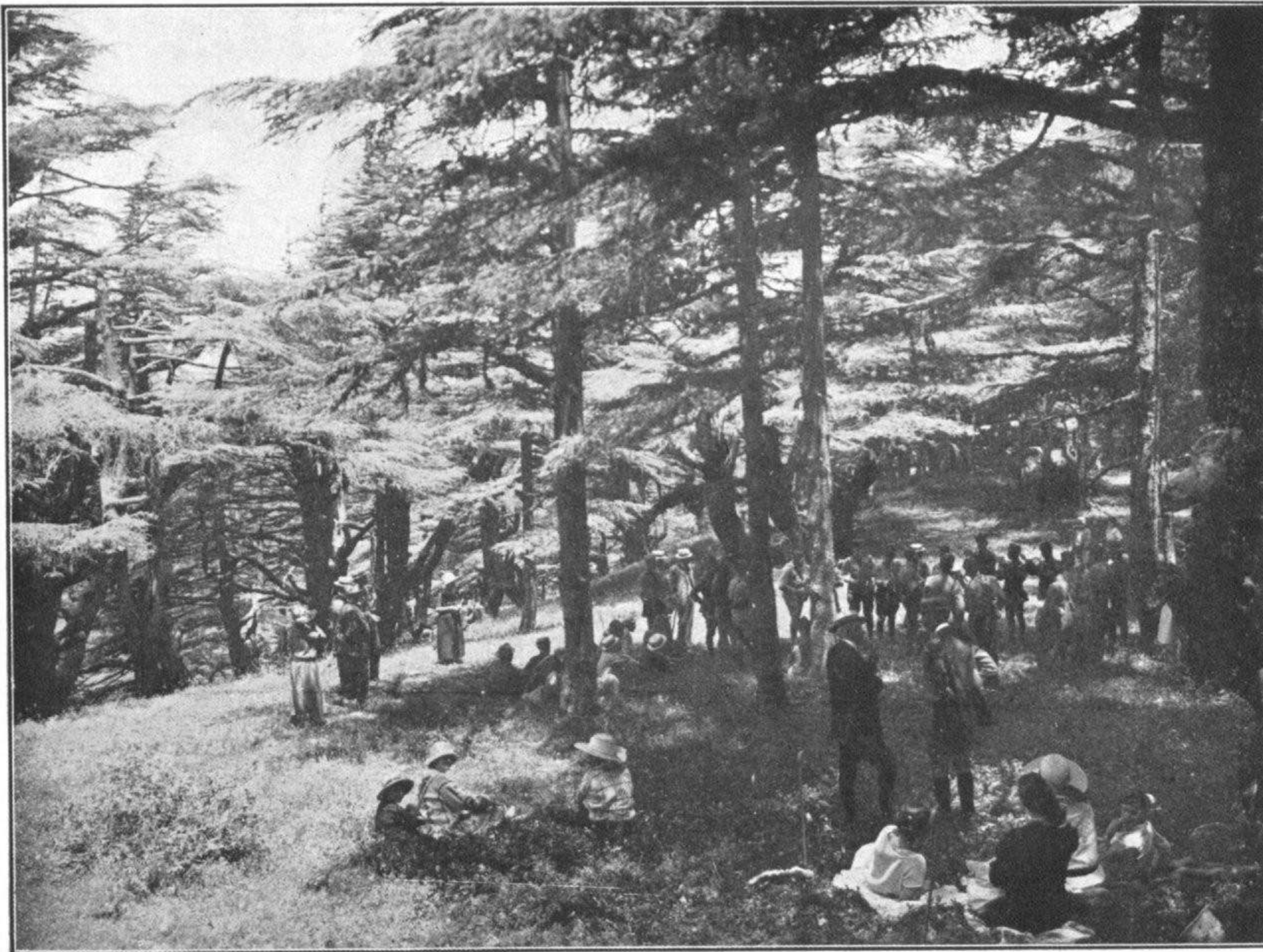
CHRÉA. — AUBADE DANS LES BOIS (17 Juin)