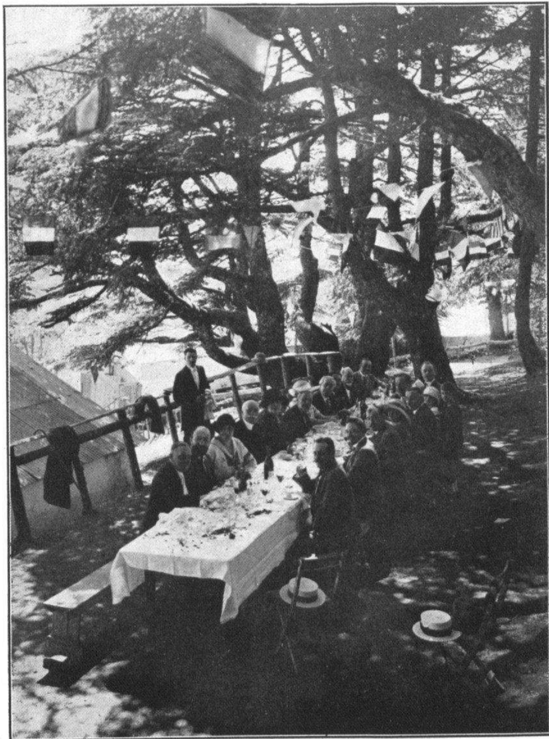
FÊTES DE CHRÉA M. Steeg, Gouverneur Général, et ses invités déjeunant sous les cèdres (17 Juin 1923)

La fête fut vraiment très réussie et les nombreux touristes qui s'y rendirent en conserveront le souvenir enchanté : les deux concerts du matin et du soir dus aux trompes de chasse des chasseurs d'Afrique et à l'orchestre du groupe d'artillerie de campagne en garnison à Blida, le rally-paper des dames et jeunes filles, le tir aux pigeons, le bal improvisé sous l'abri des grands cèdres furent les étapes réussies d'une journée qui comptera dans les fastes de la cité Blidéenne et de Chrèa-super-Blida.