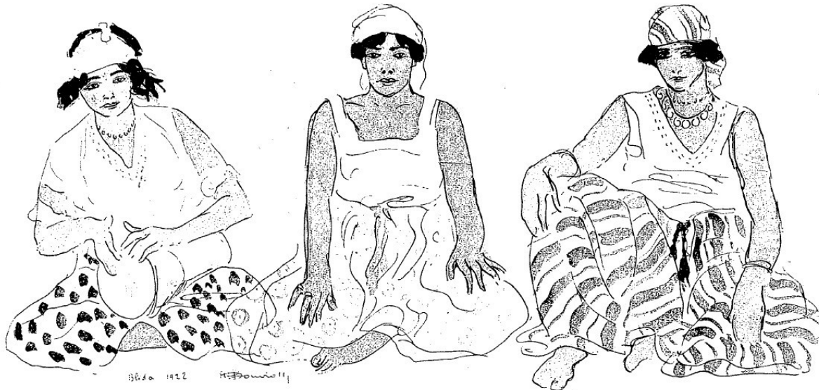
Les marchandes d'amour.

Plus loin, voici Becour, le quartier des femmes, avec ses ruelles blanches et bleues, ses terrasses, ses portes basses à judas, guichets grillagés de barreaux comme ceux des cloîtres du moyen-âge.