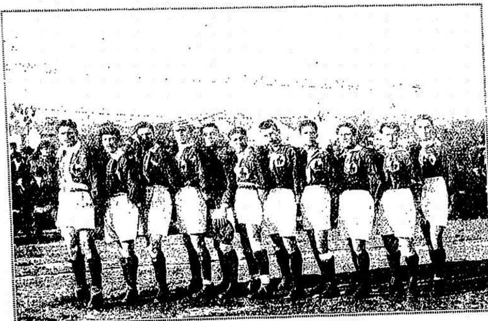
L'équipe du « Gallia Sports »

Le match du dimanche, 2, a été en tous points beaucoup plus intéressant, le Foot Ball Club Blidéen,