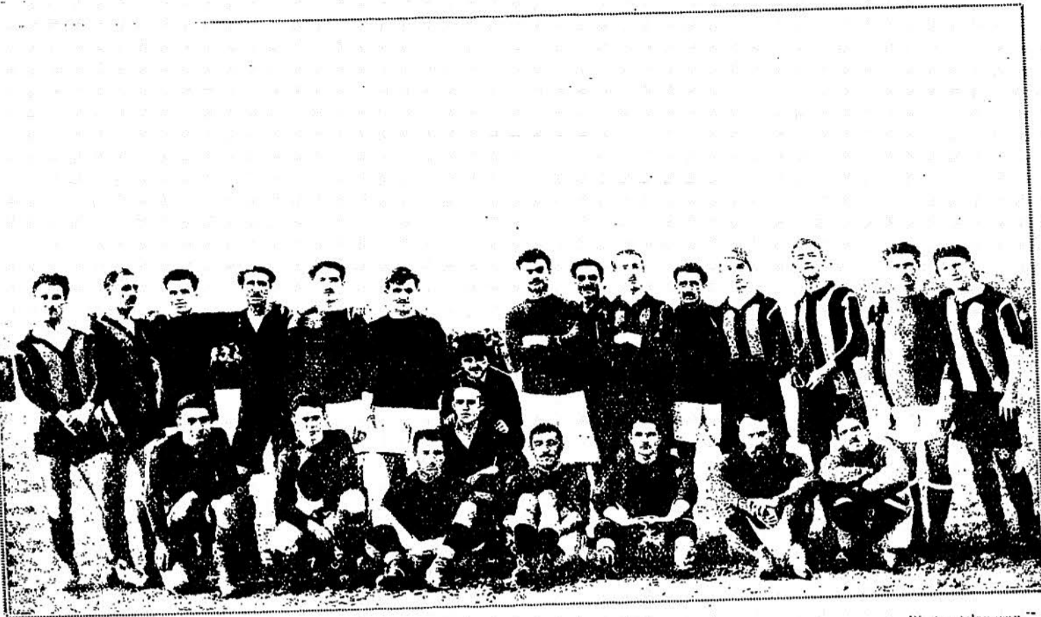
L'équipe Levallois et l'équipe blidéenne.